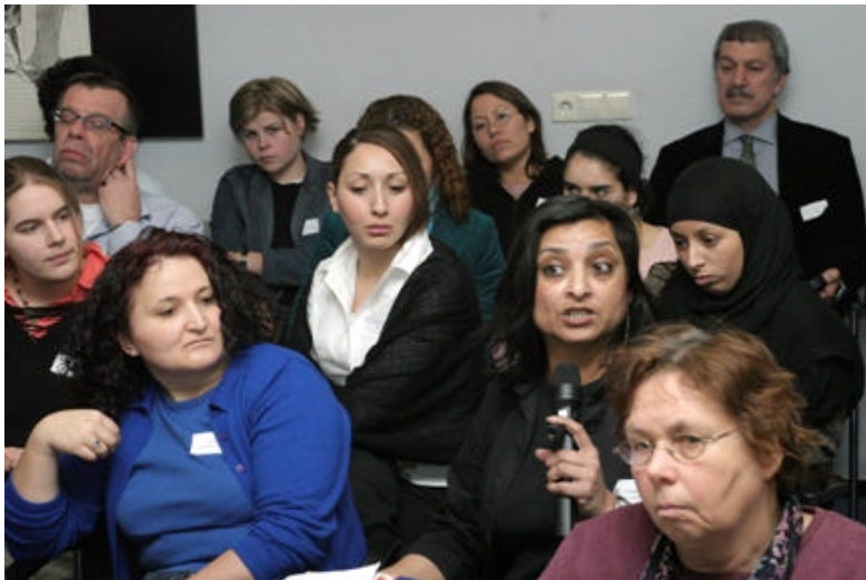
Een deelnemster maakt een punt.

Aanbeland bij het tweede gedeelte van de workshop over de oplossingen om huiselijk geweld in te perken, te voorkomen of de discussie daarover aan te zwengelen, kwam breed naar voren dat de hulpverlening wel een belangrijke rol kan spelen. Maar dat de vrouwen zelf het initiatief moeten nemen. Een gezinstherapeut: "Er moet onder vrouwen een bewustwordingsproces op gang worden gebracht. Vrouwen moeten om te beginnen zelf niet accepteren dat ze geslagen worden. Het is een illusie om te denken dat wetten en regels huiselijk geweld volkomen kunnen uitbannen. Bovendien is de nieuwe wetgeving in Marokko pas ongeveer een jaar geleden ingevoerd. Of dat zal leiden tot meer scheidingen wegens huiselijk geweld en uiteindelijk tot minder huiselijk geweld, is eigenlijk pas over tien jaar met redelijkheid te zeggen. Ondertussen moeten vrouwen zich blijven verzetten tegen hun gewelddadige mannen."