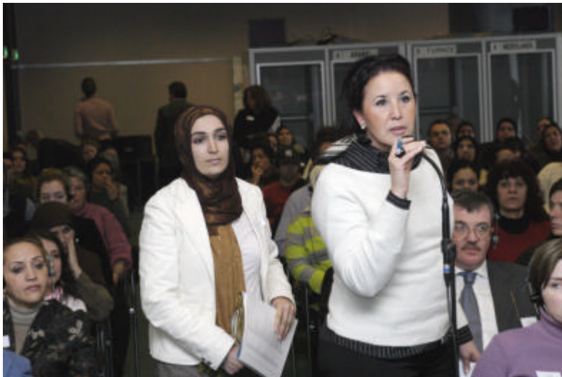
De ruimte voor vragen werd volop benut.

Maar verreweg de meeste vragen getuigden van een grote belangstelling en nieuwsgierigheid bij de professionals en de Marokkaanse en Turkse vrouwen. Een greep: “Wanneer wordt de nieuwe wetgeving geïmplementeerd?” - “Sinds wanneer is het nieuwe recht van toepassing? Wanneer moeten de huwelijken gesloten zijn?” - “Voor wie geldt het Marokkaanse familierecht; kunnen buitenlandse vrouwen die met Marokkanen zijn getrouwd ook rechten ontleen aan de nieuwe familiewetgeving?” – “Zou Marokko openstaan voor een bilateraal verdrag met Nederland, waarin de rechten van vrouwen worden vastgelegd?”