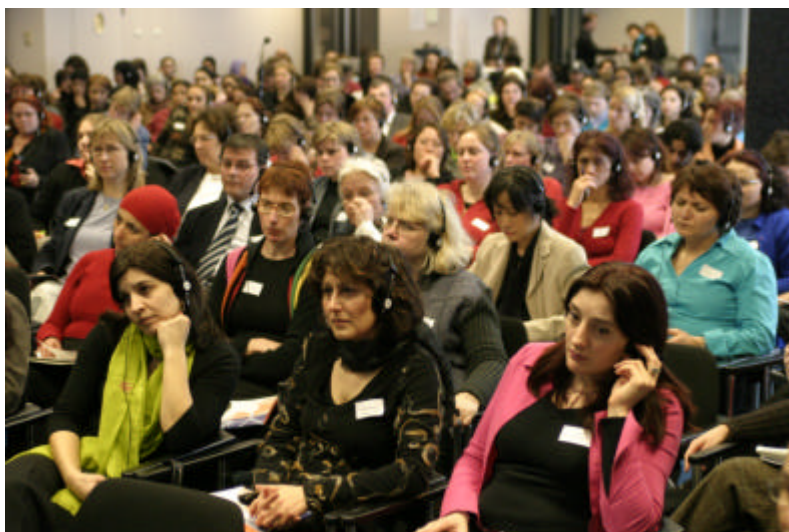
De conferentie trok een volle zaal in de Jaarbeurs.

Op donderdag 17 februari 2005 werd de conferentie in het kader van de themawEEK 'Vrouwenrechten in beweging' gehouden in de Jaarbeurs in Utrecht. Het thema van de week was de (rechts)positie van allochtone vrouwen in Nederland. Deze is in gevallen zoals huwelijk, echtscheiding, erfenis en nalatenschap sterk afhankelijk van wetgeving in de landen van herkomst. In Marokko en Turkije zijn de laatste jaren belangrijke veranderingen in onder andere het familie- en strafrecht doorgevoerd. Vrouwenorganisaties in Marokko en Turkije hebben een grote rol gespeeld bij de totstandkoming van deze wetwijzigingen. Tijdens de conferentie werd dit thema verder uitgediept. De veranderende rechten van Marokkaanse en Turkse vrouwen in relatie tot hun (rechts)positie en emancipatie stonden centraal.