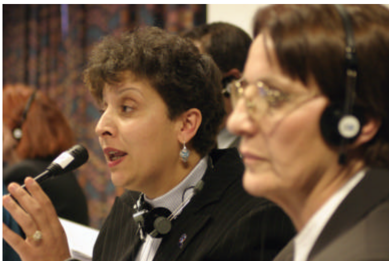
De delegatieleden nemen deel aan het plenaire eindprogramma.