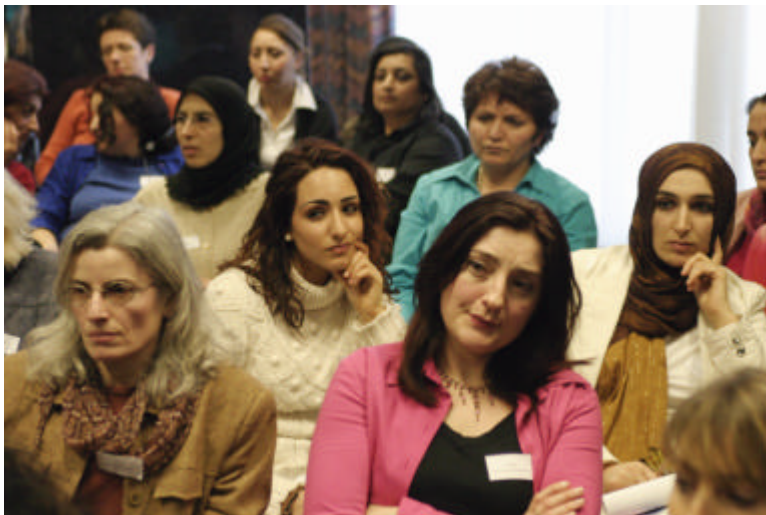
Men luisterde geboeid naar de strijd van Turkse vrouwenrechtenactivisten.

Maar op het platteland laat de naleving van de nieuwe wetgeving nog altijd te wensen over. “Een rechter in Anatolië kan moeilijk verteren dat een man op straat wordt gezet omdat hij zijn vrouw heeft geslagen. Terwijl het huis op zijn naam staat. We zijn er dus nog niet met de wetwijzigingen: er moet ook een mentaliteitsverandering plaatsvinden.”