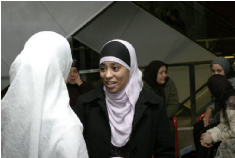
De conferentie bood ook na afloop veel stof tot discussie over de emancipatie van de Marokkaanse en Turkse vrouw.

Een ondernemster uit Rotterdam vindt ook dat er meer aandacht moet komen voor de positie van de man. “Als het bijvoorbeeld om integratie gaat, richten we ons alleen maar op vrouwen. Maar mannen willen ook graag de taal leren en de dialoog aangaan. Een voorwaarde is dan wel dat ze zich niet alleen in de Turkse omgeving ophouden. Wat Maxima onlangs zei: ze kiest voor Nederland. Dat is ook zo. Ik ben er tegen om met het ene been in Turkije en met het andere been in Nederland te staan. Nee, je woont hier en kiest dus voor dit land. Laten we zorgen dat we het hier goed hebben. Ik houd van Nederland. Hoewel het maatschappelijke en politieke klimaat in Nederland is veranderd. Het is in alle opzichten winter.”