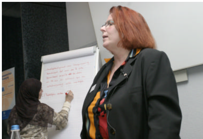
Onder leiding van de workshop voorzitter ontstond een brede discussie over huiselijk geweld.