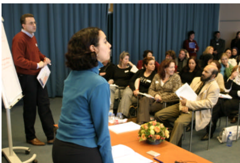
De workshopvoorzitter luistert aandachtig naar de inbreng van een deelnemer.